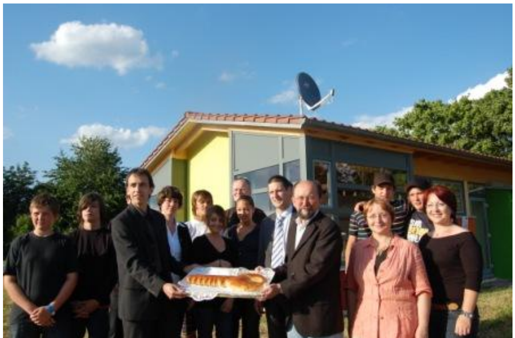
Symbolische Schlüsselübergabe bei der Eröffnungsfeier am 12.Juni 2009

Folgender link führt Sie auf die Internetseite des Jugendhauses mit weiteren Informationen und Bildern: www.jugendhaus-hirschberg.de